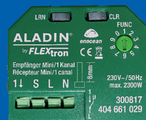
ALADIN Empfänger Mini, 230 V, 1 Kanal, UP Art.Nr. 300817 E-Nr. 404 661 029