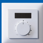
ALADIN Thermostat radio No.d'art. : 300370 E-No. : 205 490 609