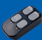
ALADIN télécommande, 4 touches No.d'art. : 300200 E-No. : 204 014 529