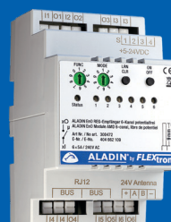
Récepteur AMD ALADIN EnO 6-canaux, Commuter No.d'art. : 300472 / E-No. : 404 662 109