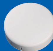
Module d'antenne AMD ALADIN No.d'art. : 300482 / E-No. : 204 900 119

Dans chaque système REG, il faut au moins une alimentation en tension (SPV) et un module d'antenne.