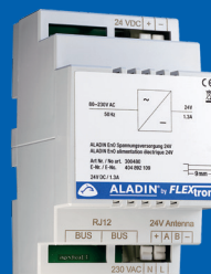
Module alimentation électrique AMD ALADIN No.d'art. : 300480 / E-No. : 404 892 109