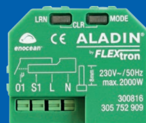
Récepteur ALADIN multi, 230 V, 1 canal, ENC No.d'art. 300816 E-No. 305 752 909