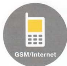
Meldungen und Steuerung